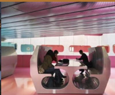
Learning expedition UPMC Sorbonne Universités