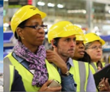
Etude de cas Common Purpose