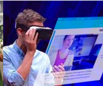
Etude de cas Labster