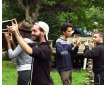
Etude de cas Maison Frateli