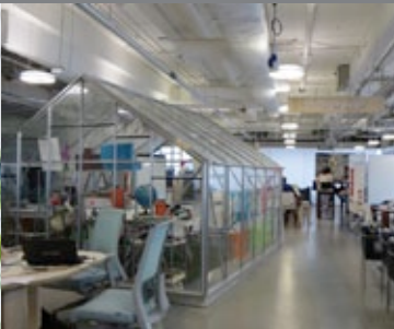
Etude de cas Aalto University & MIT / School as a Service