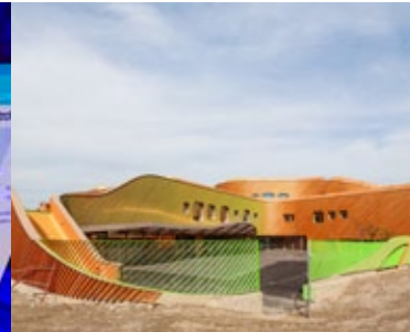
Etude de cas Ecole Niki de St. Phalle