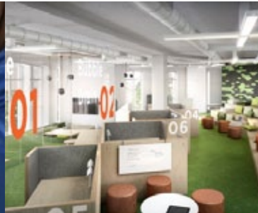
Etude de cas EM Lyon