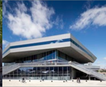
Etude de cas Dokk1 Aarhus