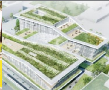
Etude de cas Campus Condorcet Paris