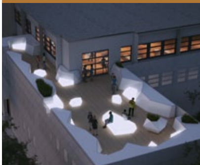
Learning expedition École 42