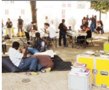
Etude de cas Libraries without Borders / Ideas Box