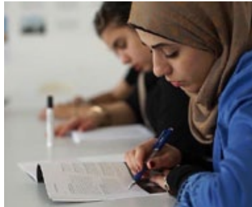
Etude de cas Kiron University

https://www.eventbrite.com/e/elig-conference-2016-learning-places-of-the-future-tickets-25475948247?ref=ebtnebtckt