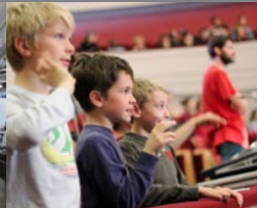
Etude de cas BOZAR & Gluon